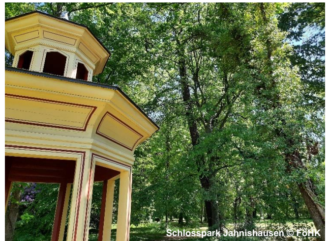
Schlosspark Jahnishausen

Verlässt man den Stadtpark, empfehlen wir einen Besuch des Stadtmuseums, nur eine Querstraße vom Jahnatalweg entfernt. Weiter geht es über die Ortsteile Pausitz und Nickritz zur Mühle Oelsitz. Sie ist eine von ehemals etwa 30 Mühlen an der Jahn. Ein Verein bietet gegen Voranmeldung, zum Mühlentag bzw. Tag des offenen Denkmals Rundgänge mit Technikvorführungen an. Nur ein Katzensprung ist es von hier nach Jahnishausen mit Schloss, Park und Schlosskirche. Vielleicht erahnen Sie bei einem Parkspaziergang, einer Schlossführung oder einem Veranstaltungsbesuch, weshalb König Johann von Sachsen und seine Frau Amalie gern viel Zeit hier verbrachten.