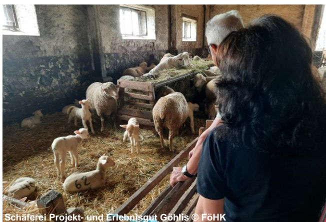
Schäferei Projekt- und Erlebnisgut Göhlis

Mit unseren Entdeckungen beginnen wir am Projekt- und Erlebnisgut in Riesa-Göhlis. In unmittelbarer Nähe zum Elberadweg finden Besucher hier zum Beispiel eine aktive Schäferei mit einer Jahrhunderte zurückreichenden Tradition. Viele Auszeichnungen am Eingangstor zum Schafstall zeigen die Erfolge der hiesigen Schäfer. Auf dem Gelände kann man außerdem auch in einem Schäferwagen übernachten. Im Bereich der befindet sich auch unser Stempelkasten von GERSTINs Entdeckertour. Ein Stück entlang des Elberadwegs gefahren, kommt man zum Stadtpark nach Riesa. Bevor man auf den Jahnatalweg in Richtung Lommatzschener Pflege fährt, lohnt sich ein Abstecher zum Kloster- und Tierpark und zur Mündung der Jahn in die Elbe gleich neben der Fähre nach Promnitz.