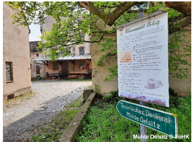
Mühle Oelsitz

Verlässt man den Stadtpark, empfehlen wir einen Besuch des Stadtmuseums, nur eine Querstraße vom Jahnatalweg entfernt. Weiter geht es über die Ortsteile Pausitz und Nickritz zur Mühle Oelsitz. Sie ist eine von ehemals etwa 30 Mühlen an der Jahn. Ein Verein bietet gegen Voranmeldung, zum Mühlentag bzw. Tag des offenen Denkmals Rundgänge mit Technikvorführungen an. Nur ein Katzensprung ist es von hier nach Jahnishausen mit Schloss, Park und Schlosskirche. Vielleicht erahnen Sie bei einem Parkspaziergang, einer Schlossführung oder einem Veranstaltungsbesuch, weshalb König Johann von Sachsen und seine Frau Amalie gern viel Zeit hier verbrachten.