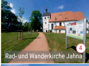
Rad- und Wanderkirche Jahnna 4