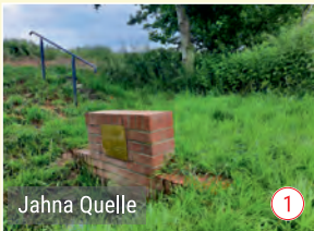
Jahna Quelle 1