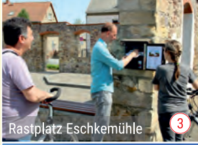
Rastplatz Eschkemühle 3