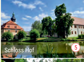
Schloss Hof 5