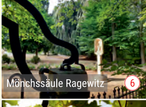
Mönchssäule Ragewitz 6