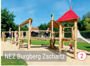
NEZ Burgberg Zschaitz 2