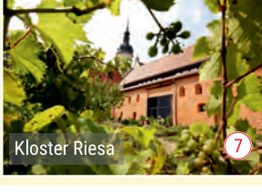
Kloster Riesa 7